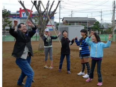
チェックポイントで楽しもう!