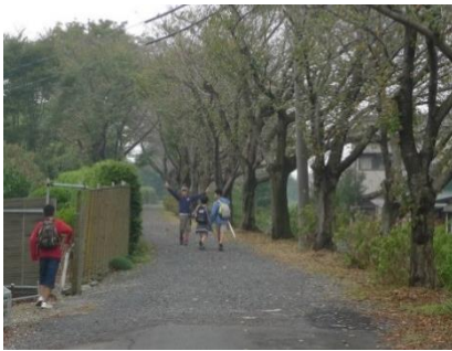
ふだんは通らないジャリ道なども歩きます

面白い外遊びをしたい小学生のみんなから、楽しく街歩きをしたい大人の皆さんまで、たくさんの参加をお待ちしております！