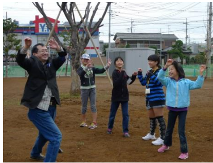
何が出るかわかりません