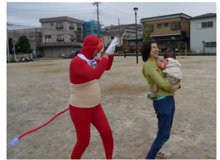
途中でゲームもあります

集合 越谷市市民活動支援センター (出発・到着) (越谷駅東口 越谷ツインシティ Bシティ 5階)